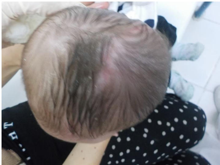
Toma de medidas.-27.09.19